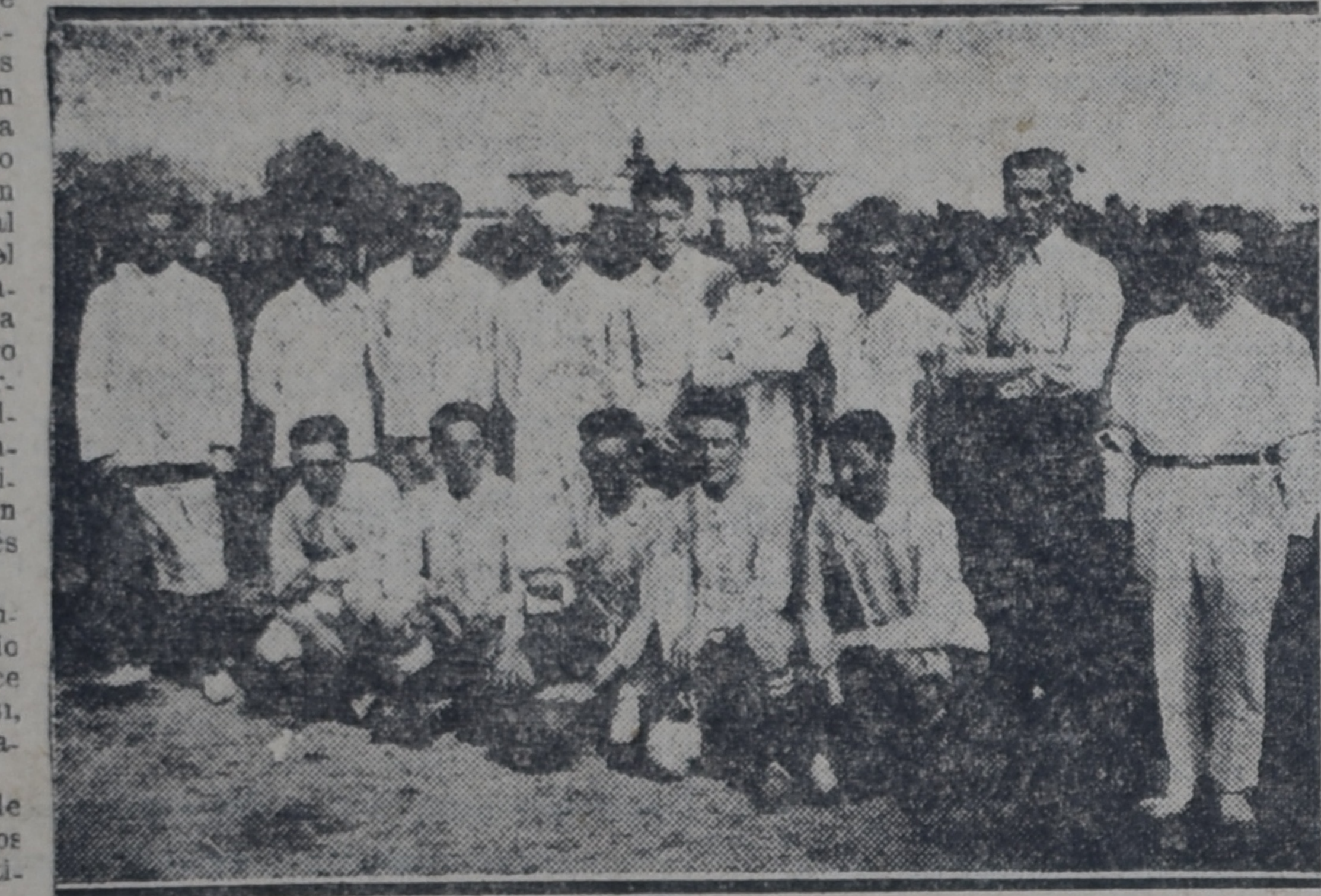
Equipo de Wilde Sporting Club

El juego siguió siendo favorable al cuadro local, que a los 25', 35' y 38',